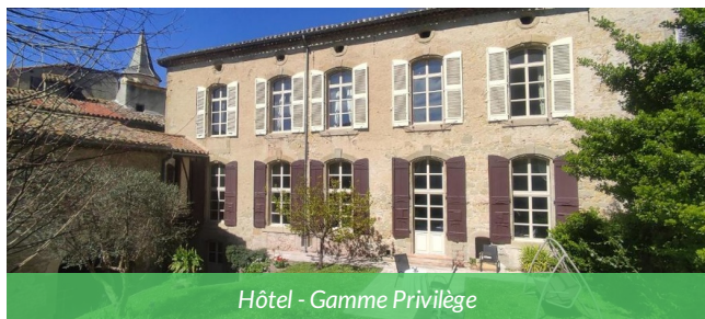
Hôtel - Gamme Privilège

Situé au cœur du Lauragais, cet hôtel **** à Castelnau-d'Aud est une halte idéale pour un voyage à vélo le long du Canal du Midi. Installé dans un hôtel particulier du XVII e siècle, il propose des chambres confortables, un petit-déjeuner maison, un parking sécurisé et un accueil chaleureux pour les cyclotouristes. Entre authenticité, confort et emplacement central, c'est l'adresse parfaite pour une étape détente à vélo.