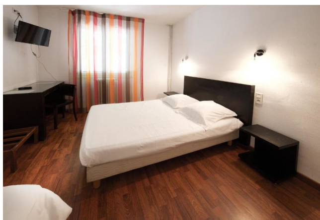
Chambre double - Gamme Essentiel

Hébergement de charme au cœur de Castelnaudary, parfait pour une halte gourmande sur la route du Canal du Midi. L'établissement propose des chambres confortables avec wifi gratuit, climatisation et local à vélos sécurisé. Son restaurant sert le véritable cassoulet de Castelnaudary, préparé selon la recette traditionnelle. Une adresse idéale pour les amateurs de gastronomie et les voyageurs à vélo souhaitant découvrir le Lauragais.