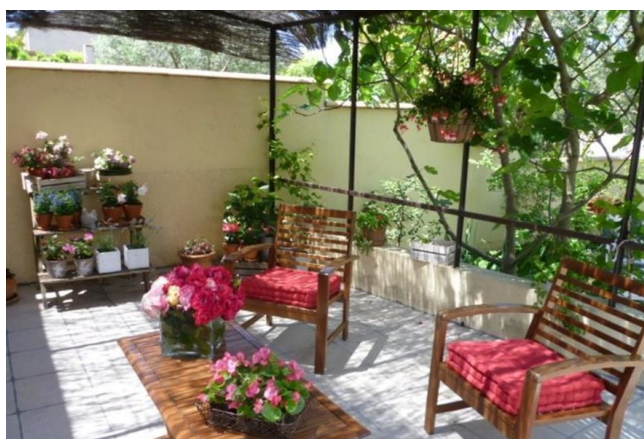
Terrasse - Gamme Essentiel

Maison d'hôtes de charme à Carcassonne, idéalement installée dans un jardin arboré avec terrasse ombragée et bassin détente. Chambres lumineuses et climatisées, Wi-Fi inclus, et table d'hôtes proposant des plats issus des légumes et fruits du jardin. Une adresse paisible pour bien terminer votre week-end à vélo dans l'Aude.