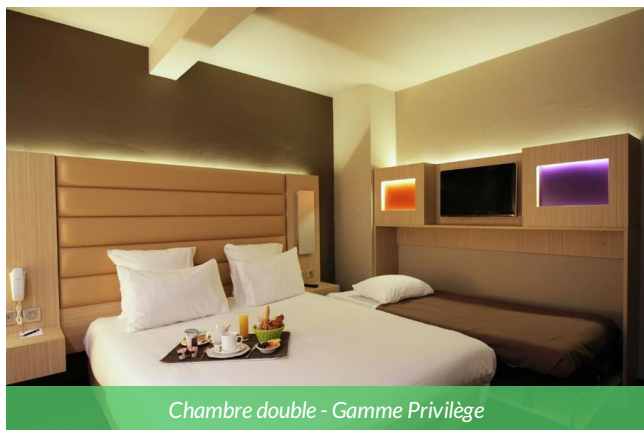
Chambre double - Gamme Privilège