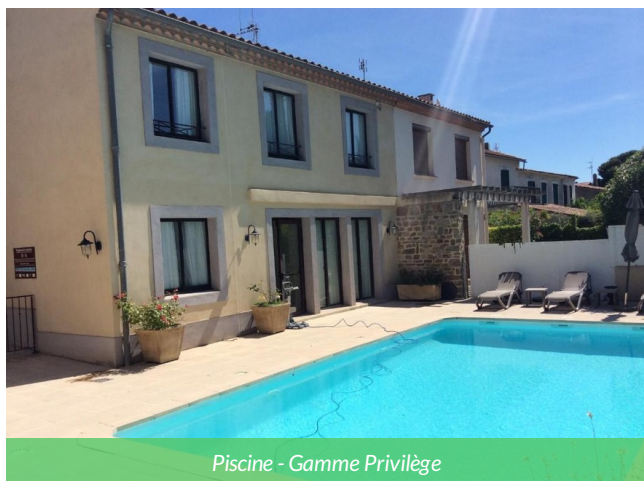
Piscine - Gamme Privilège

Au cœur de Carcassonne, cet hôtel *** est une étape idéale pour les cyclotouristes. Confort, charme et piscine vous attendent après votre journée à vélo, à deux pas de la cité médiévale. Un endroit parfait pour allier détente et découverte à la fin de votre Week end à vélo sur le canal du midi.