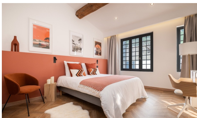
Chambre Double - Gamme Confort

Charmante maison d'hôtes située au cœur de Carcassonne, à deux pas de la cité médiévale. Climatisée et dotée d'un accès Wi-Fi gratuit, elle offre une cour privative avec bassin extérieur, parfaite pour bien terminer ce Week end à vélo. Idéalement placée pour découvrir la cité, cette adresse allie confort, caractère et hospitalité.