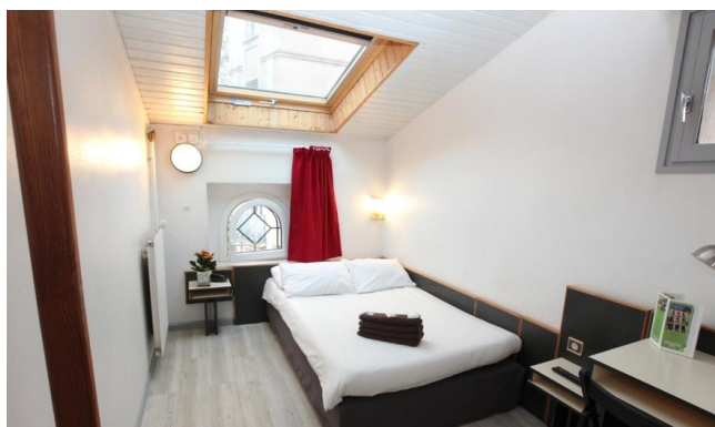
Chambre double - Gamme Essentiel