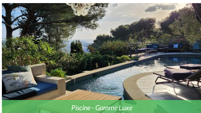
Piscine - Gamme Luxe

Maison d'hôtes de charme, idéale pour une étape vélo de luxe sur le Canal du Midi. Nichée dans un jardin paisible avec piscine, elle propose des chambres élégantes et confortables, et un espace bien être parfait pour se détendre après une journée de cyclotourisme sur le canal du midi. À proximité des canaux et du centre historique, c'est une adresse raffinée pour allier séjour haut de gamme, confort et découverte de l'Occitanie.