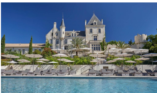
Piscine - Gamme Luxe

Domaine viticole d'exception niché entre vignes et garrigue, cet hôtel-château offre une expérience unique au cœur du Languedoc. Entre séjour œnotouristique, escapade à vélo et détente au bord de la piscine à débordement, il combine charme historique et confort contemporain. Ses suites et villas au style raffiné, son restaurant gastronomique et son atmosphère paisible en font une adresse incontournable pour un séjour de prestige sur le canal du midi.