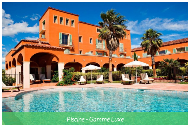
Piscine - Gamme Luxe