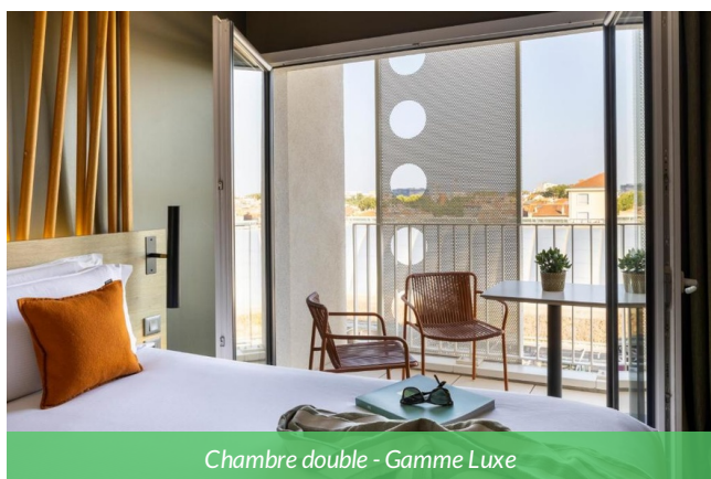
Chambre double - Gamme Luxe

Hôtel 4 étoiles en plein cœur de Montpellier, idéal pour clôturer votre séjour sur une note élégante. Labellisé Accueil Vélo, il propose des chambres design, un spa, un bar à cocktails et une brasserie moderne, un cadre parfait pour un séjour urbain haut de gamme entre détente et expérience citadine. Idéal pour la fin d'un séjour plein de souvenirs.