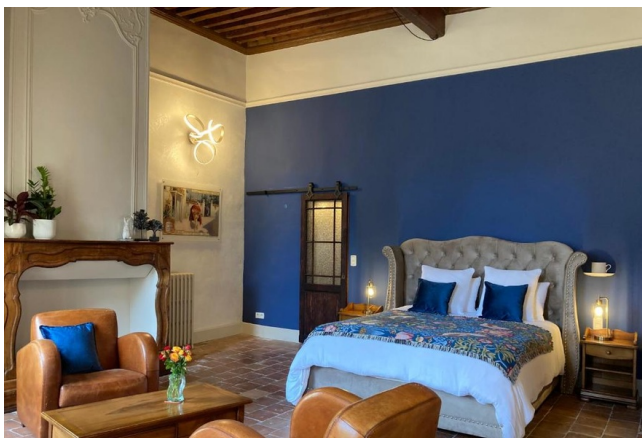
Notre hôtel partenaire à Castelnaudary

Hébergement de charme au cœur de Castelnaudary, cette demeure historique du XVII e siècle vous accueille dans une ambiance raffinée et paisible. Avec Wi-Fi gratuit, parking privé et jardin tranquille, c'est l'étape idéale pour les cyclistes en quête de confort haut de gamme. Située à proximité du centre historique, elle offre une pause élégante et bien installée pour découvrir le Lauragais en tout sérénité. Les chambres aux couleurs fleurissant vous plonge dans un cadre d'époque avec sa décoration baroque.