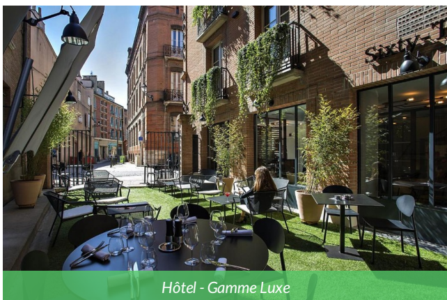
Hôtel - Gamme Luxe

Hôtel 4 étoiles à Toulouse, idéal pour les cyclistes haut de gamme. Cet établissement design propose des chambres spacieuses et élégantes, un accueil personnalisé et des services premium pour un séjour vélo de luxe au cœur de la Ville Rose. Parfaitement situé à proximité des principaux itinéraires cyclistes et sites touristiques, il offre confort, détente et raffinement pour un lieu de départ idéal.