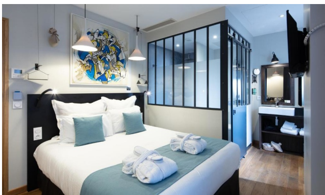
Chambre double - Gamme d'exception

Hôtel 4 étoiles à Toulouse, idéal pour les cyclistes haut de gamme. Cet établissement design propose des chambres spacieuses et élégantes, un accueil personnalisé et des services premium pour un séjour vélo de luxe au cœur de la Ville Rose. Parfaitement situé à proximité des principaux itinéraires cyclistes et sites touristiques, il offre confort, détente et raffinement pour un lieu de départ idéal.