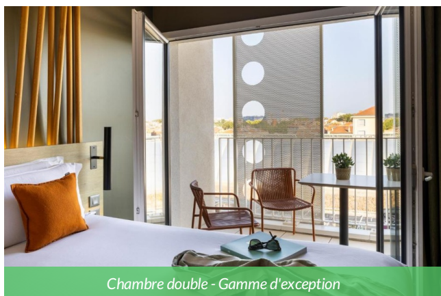
Chambre double - Gamme d'exception

Hôtel 4 étoiles en plein cœur de Montpellier, idéal pour clôturer votre séjour sur une note élégante. Labellisé Accueil Vélo, il propose des chambres design, un spa, un bar à cocktails et une brasserie moderne, un cadre parfait pour un séjour urbain haut de gamme entre détente et expérience citadine. Idéal pour la fin d'un séjour plein de souvenirs.