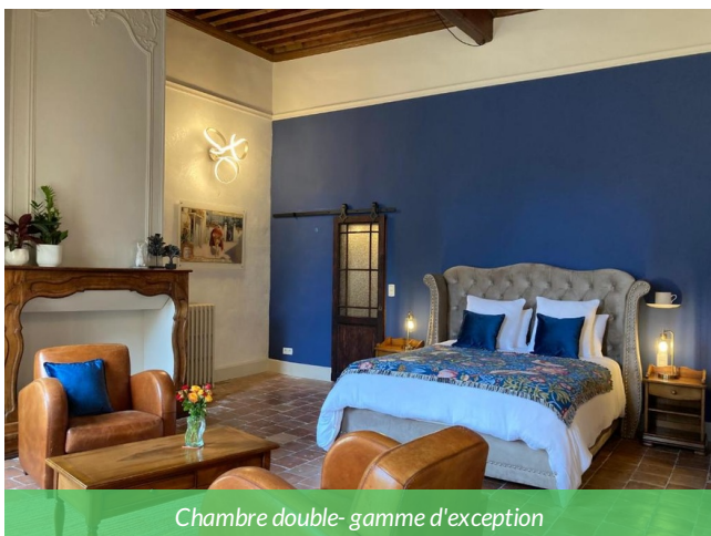
Chambre double- gamme d'exception

Hébergement de charme au cœur de Castelnaudary, cette demeure historique du XVII e siècle vous accueille dans une ambiance raffinée et paisible. Avec Wi-Fi gratuit, parking privé et jardin tranquille, c'est l'étape idéale pour les cyclistes en quête de confort haut de gamme. Située à proximité du centre historique, elle offre une pause élégante et bien installée pour découvrir le Lauragais en toute sérénité. Les chambres aux couleurs fleurissantes vous plongent dans un cadre d'époque avec sa décoration baroque.