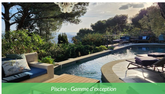
Piscine - Gamme d'exception