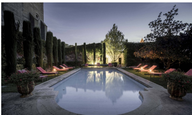
Piscine - Gamme d'exception

Hôtel 4 étoiles au charme contemporain, niché face aux remparts de la Cité de Carcassonne, cet établissement allie élégance, sérénité et confort. Son cadre verdoyant, sa piscine et sa terrasse avec vue en font une halte privilégiée pour les amateurs de cyclotourisme ou de séjours culturels. Avec son atmosphère intimiste et son service soigné, c'est une adresse d'exception pour profiter pleinement de l'art de vivre occitan.