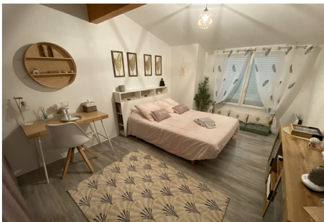
Chambre double - Gamme Confort

Nichée au cœur du prestigieux vignoble de Margaux, l'auberge allie charme, authenticité et raffinement. Ancienne demeure viticole transformée en hôtel de caractère, elle propose un cadre paisible entre vignes et estuaire. Le restaurant met à l'honneur la gastronomie du terroir, accompagnée des plus grands crus classés du Médoc. Une halte idéale pour les amateurs de vin, de nature et de bien-être.