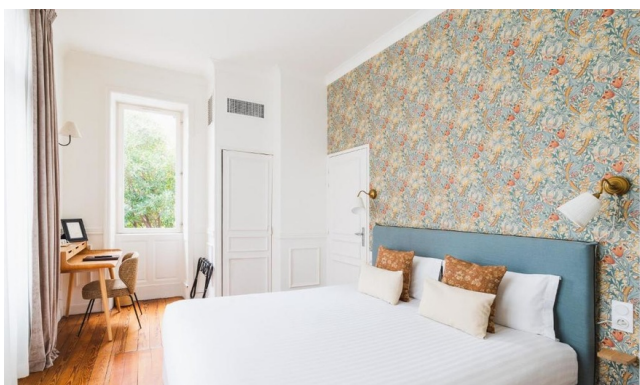
Chambre double - Gamme Privilège

-- NB : ces hébergements sont des exemples.