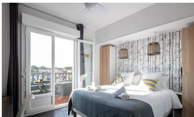
Chambre double - Gamme Confort