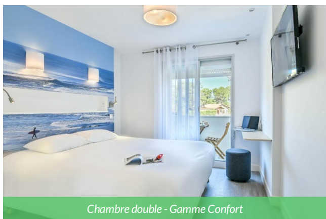
Chambre double - Gamme Confort

À deux pas de l'océan et au cœur de la pinède, l'Hôtel offre un cadre paisible et naturel pour un séjour détente. Ses chambres confortables, son restaurant aux saveurs du Sud-Ouest et son jardin ombragé en font un lieu idéal pour se ressourcer entre plage, forêt et balades à vélo. Labellisé "Écolabel Européen", l'établissement s'engage pour un tourisme plus responsable. Les activités à proximité feront de ce lieu un point d'étape parfait pour découvrir la côte landaise