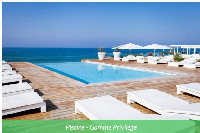
Piscine - Gamme Privilège

Perché sur la dune face à l'océan Atlantique, l'hôtel offre un décor unique où l'eau et le ciel se confondent. Toutes les chambres bénéficient d'une vue dégagée sur la mer pour une immersion totale. L'établissement associe patrimoine et modernité, avec des équipements haut de gamme : piscine à débordement, bar lounge, restaurant gastronomique et chambres climatisées insonorisées: une belle étape pour un séjour mêlant mer, nature et confort contemporain.