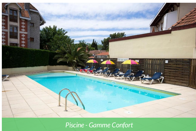
Piscine - Gamme Confort