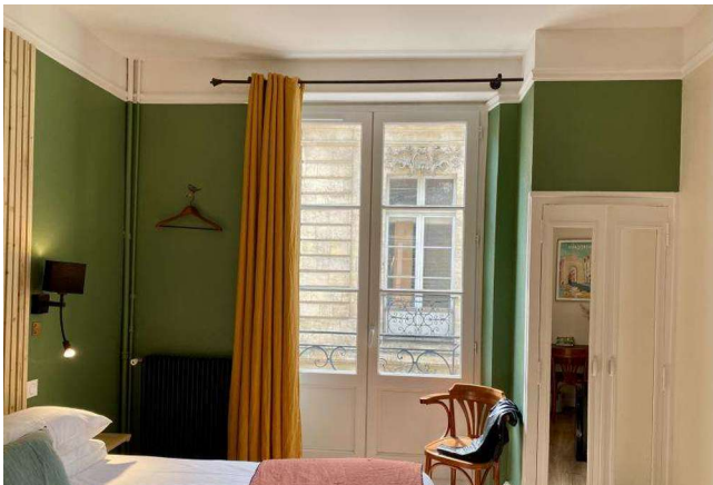
Chambre double - Gamme Privilège

Situé au cœur de Bordeaux, cet hôtel de charme occupe un élégant immeuble en pierre typique du centre historique. Il propose une atmosphère intime et contemporaine, des chambres confortables et un emplacement idéal pour découvrir la ville à pied en commençant un séjour à vélo.