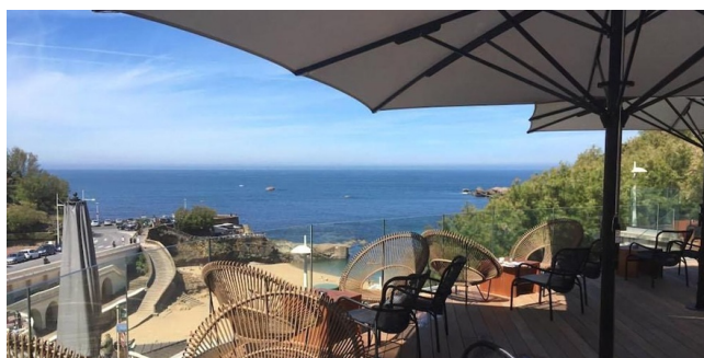
Restaurant - Gamme Confort

Surplombant la plage, l'hôtel offre une parenthèse écoresponsable face à l'océan. Avec ses chambres à la décoration épurée, sa restauration locale et son accès facile à pied ou à vélo, l'établissement mise sur la simplicité, la nature et une démarche durable, en plein cœur de Biarritz.