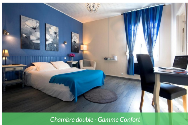
Chambre double - Gamme Confort

À seulement 200 m de la plage, l'Hôtel vous accueille dans une ambiance simple et chaleureuse. Ses chambres confortables, son emplacement central et ses services pratiques en font une adresse idéale pour profiter de l'océan, des commerces et des pistes cyclables de la côte landaise. Un vrai havre de paix et de repos.