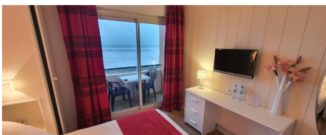
Chambre double - Gamme Confort

Situé en plein cœur de Lacanau, à deux pas de la plage, l'Hôtel vous accueille dans une ambiance chaleureuse et décontractée. Idéal pour un séjour balnéaire, il offre des chambres confortables, certaines avec vue mer, et un accès direct aux commerces, restaurants et activités nautiques. Un point de départ parfait pour profiter de l'océan et des charmes de la côte Atlantique.