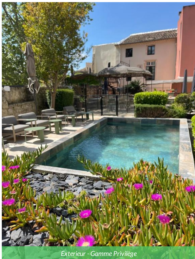
Exterieur - Gamme Privilège