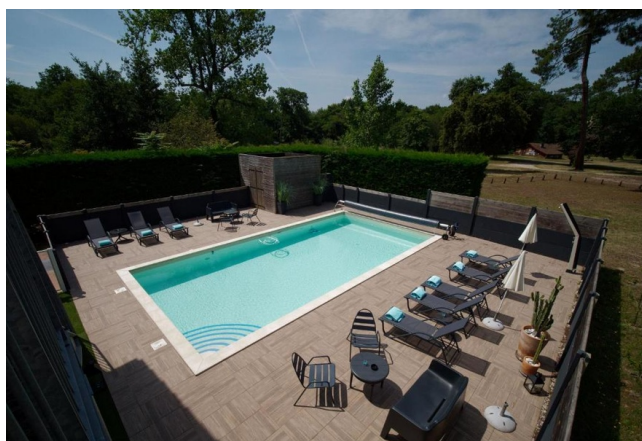
Piscine - Gamme Privilège