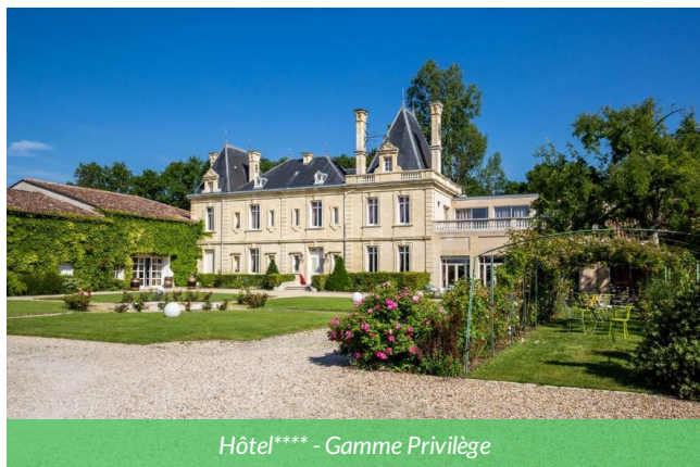
Hôtel**** - Gamme Privilège