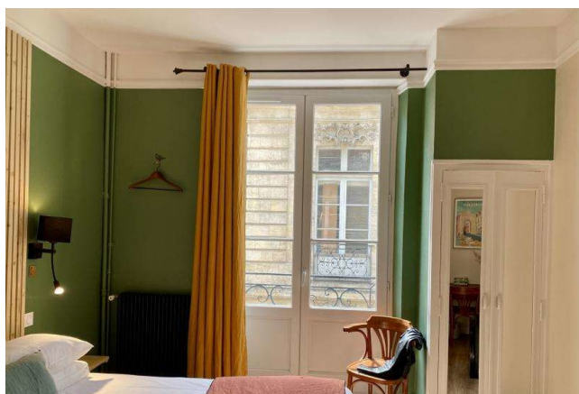
Chambre double - Gamme Privilège

Situé au cœur de Bordeaux, cet hôtel de charme occupe un élégant immeuble en pierre typique du centre historique. Il propose une atmosphère intime et contemporaine, des chambres confortables et un emplacement idéal pour découvrir la ville à pied en commençant un séjour à vélo.