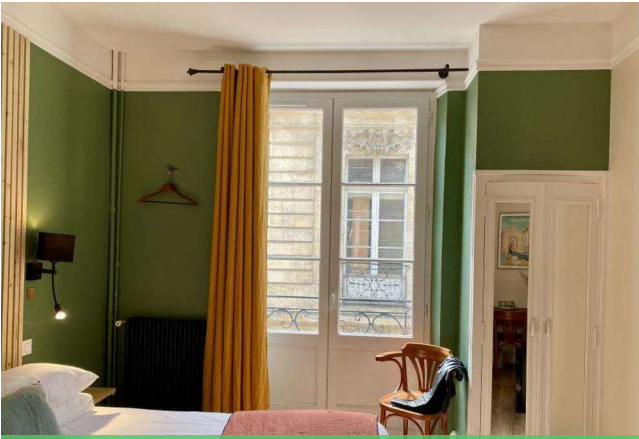
Chambre double - Gamme Privilège

Situé au cœur de Bordeaux, cet hôtel de charme occupe un élégant immeuble en pierre typique du centre historique. Il propose une atmosphère intime et contemporaine, des chambres confortables et un emplacement idéal pour découvrir la ville à pied en commençant un séjour à vélo.