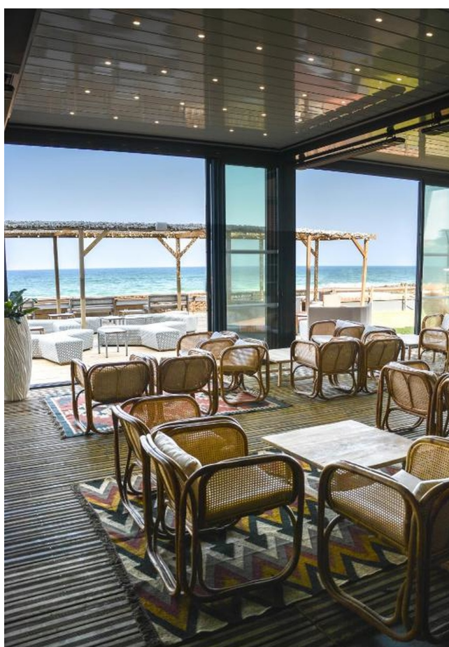
Restaurant - Gamme Privilège

Face à l'océan, l'Hôtel & Spa vous accueille dans un cadre élégant, entre mer et bien-être. Ses chambres entièrement rénovées dans un style contemporain « bord de mer et pinède » bénéficient d'une vue imprenable sur l'océan, son spa et sa terrasse panoramique invitent à la détente. Engagé pour l'environnement, l'établissement est certifié Ecolabel Européen. Un lieu raffiné où confort et responsabilité se rencontrent.