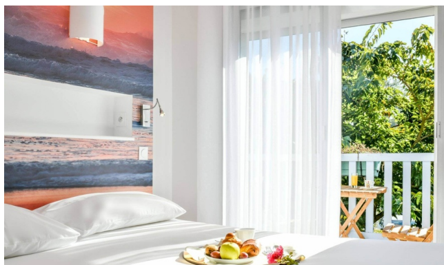
Hôtel *** à Biscarosse

Pour cette formule, nous vous proposons une sélection d'hôtels simples et confortable en 2*.