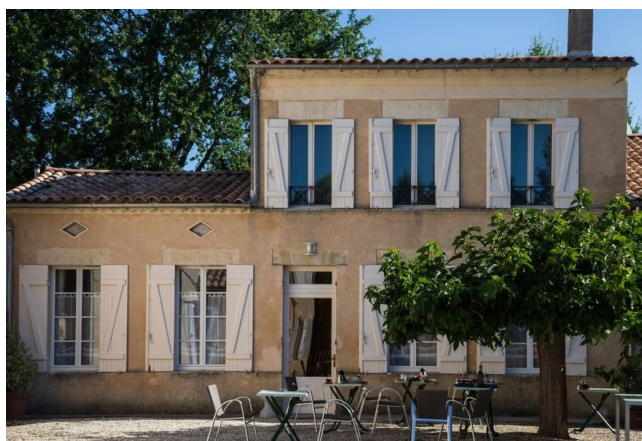
Domaine - Gamme Confort

Au cœur des vignobles du Médoc, ce domaine viticole offre une parenthèse paisible dans un cadre élégant et authentique. Les chambres, aménagées avec soin, s'ouvrent sur un environnement verdoyant propice au repos. La piscine extérieure invite à la détente après une journée de découvertes entre châteaux, villages et routes des vins, pour un séjour tout en douceur et art de vivre médocain.