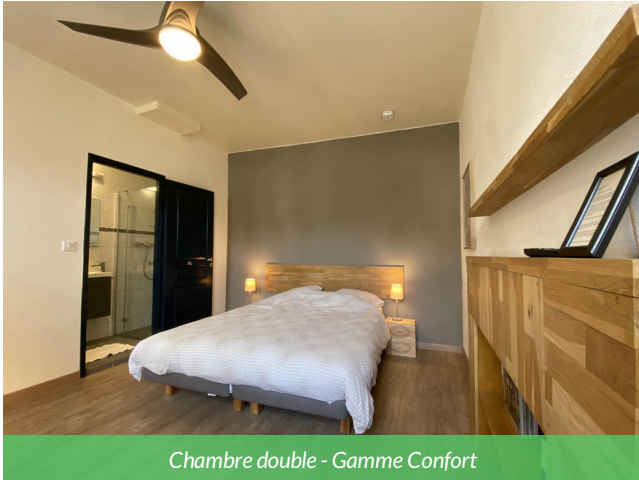
Chambre double - Gamme Confort

Cet hébergement est une adresse de charme située en plein cœur du centre historique de Bordeaux, à deux pas des quais de la Garonne et du quartier Saint-Pierre. Installé dans un élégant bâtiment ancien, l'établissement séduit par son atmosphère intimiste, son calme et sa décoration soignée. Les chambres offrent un cocon confortable, idéal pour profiter de la ville à pied, entre patrimoine, restaurants et ambiance bordelaise.