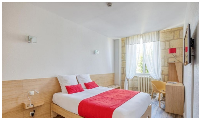
Double Room - Confort Range

You will enjoy a stay in the heart of Bordeaux, in a hotel rich in history. Built from the city's iconic golden stone, this establishment has stood since 1850. You will quickly feel at home and particularly appreciate the warm, friendly, and attentive welcome, as well as the high standards of cleanliness for which the hotel is known. The décor, the emblematic golden stone of Bordeaux, the bright common areas, the charming staircase, and the guesthouse-style atmosphere will all delight you and provide the perfect setting to begin your stay.