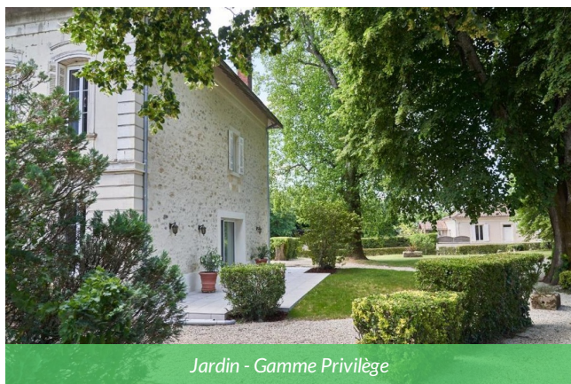
Jardin - Gamme Privilège

Ce Château est une élégante demeure de caractère située au cœur des vignobles de l'appellation Sainte-Croix-du-Mont, dominant la vallée de la Garonne. L'hébergement séduit par ses chambres confortables et raffinées, ses espaces communs chaleureux et son environnement calme. Le jardin arboré et le domaine viticole offrent un cadre idéal pour vous détendre à la fin de votre séjour à vélo.