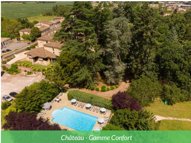
Château - Gamme Confort

séduit par son cadre paisible au cœur des vignobles de l'Entre-deux-Mers. La propriété dispose également d'une piscine extérieure, idéale pour se détendre après une journée de découverte entre Garonne, villages de caractère et paysages viticoles, dans une atmosphère élégante et reposante. C'est l'endroit idéal pour finir votre séjour à vélo