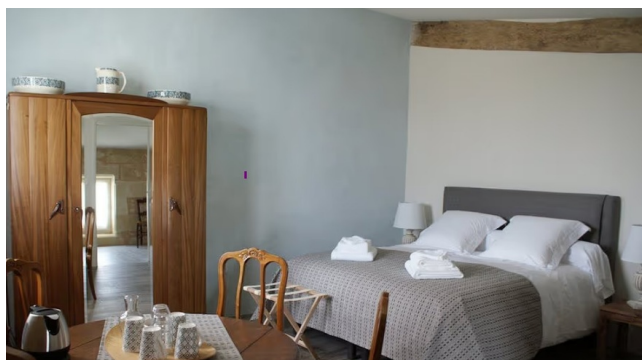
Chambre Double - Gamme Confort

Nichée dans un écrin de verdure à deux pas de l'estuaire de la Gironde, cette chambre d'hôtes séduit par son atmosphère paisible et chaleureuse. Les chambres confortables, le jacuzzi et le jardin invitent à la détente, tandis que la proximité de Bourg-sur-Gironde permet de flâner entre ruelles charmantes, panorama sur l'eau et douceur de vivre locale.