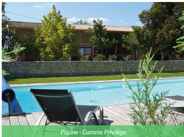
Piscine - Gamme Privilège

Ce lieu est une belle demeure de caractère située au cœur du Médoc, entourée de vignes et de paysages typiques de l'appellation Margaux. Le lieu séduit par son atmosphère paisible, sa piscine, son charme authentique et son cadre verdoyant, idéal pour une parenthèse au calme entre patrimoine viticole, nature et art de vivre bordelais.