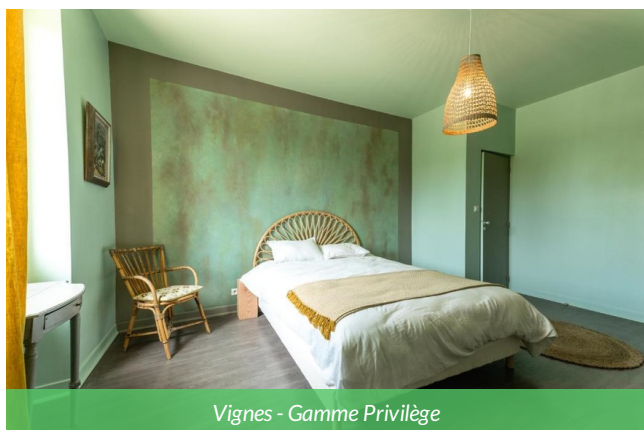
Vignes - Gamme Privilège

Cette demeure de caractère est située dans un vaste parc arboré, aux portes de Bordeaux. L'établissement allie le charme de l'architecture classique à des aménagements contemporains pensés pour le confort : chambres élégantes et bien équipées, espaces communs lumineux, terrasses et piscine extérieure pour se détendre en saison. Son environnement calme, tout en restant proche du centre-ville et des vignobles, en fait une étape idéale pour conjuguer repos, nature et découverte du Bordelais.