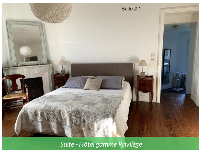
Suite - Hôtel gamme Privilège