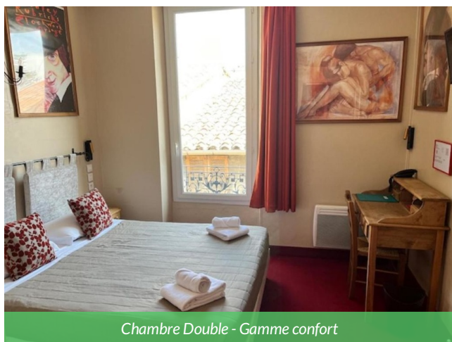
Chambre Double - Gamme confort