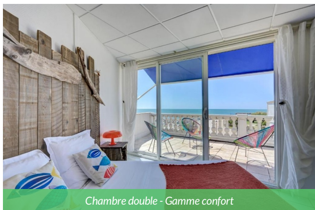
Chambre double - Gamme confort

Etablissement de charme, face à la mer au cœur du village des Saintes-Maries-de-la-Mer, en Camargue. L'hôtel offre un choix de chambres larges dans un cadre convivial et chaleureux, typique de l'ambiance Camarguaise. Un petit déjeuner de qualité y est servi et la majorité des chambres sont équipées de la climatisation.