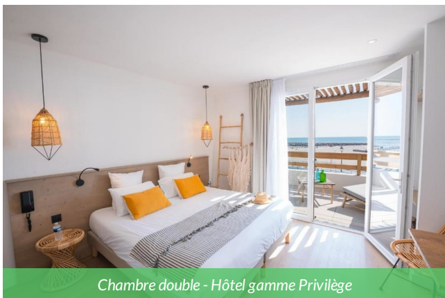
Chambre double - Hôtel gamme Privilège

Des chambres de style à la fois épuré et bohème, à partir de matériaux naturels et végétaux. Les chambres sont très bien équipées et elles ont notamment la climatisation.