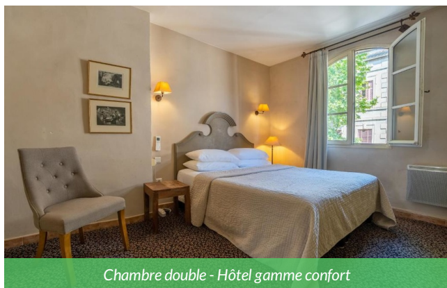
Chambre double - Hôtel gamme confort

Petit-déjeuner gourmet à base de produits locaux pour bien commencer votre journée, personnels bilingue, et une localisation idéale permettant de rayonner à pied sur les plus beaux sites.