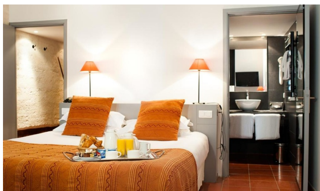
Chambre double - Hôtel gamme Privilège