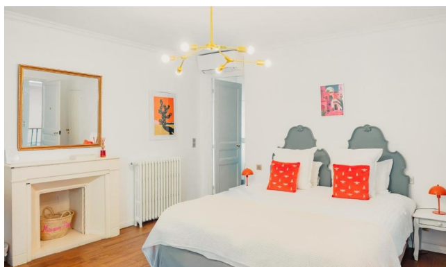
Chambre double - Hôtel gamme Privilège

Maison d'hôtes de style néoclassique datant de la fin du XIX e siècle située face au centre historique de Arles. Elle offre un emplacement privilégié au cœur de la ville tout en offrant un charme tranquille avec son jardin et sa terrasse ombragée. Les chambres, de style épuré et chaleureux, sont toutes équipées d'une literie de qualité et de la climatisation.