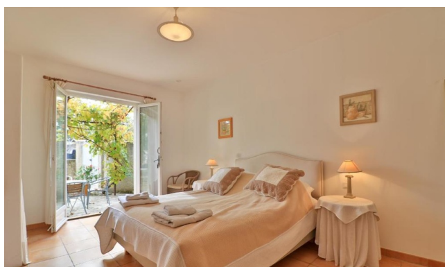
Chambre double - Hôtel gamme Privilège

Au cœur des Alpilles, à seulement 5 minutes du centre historique de Saint-Rémy-de-Provence, cette magnifique maison d'hôtes offre un charme provençal mêlant calme et convivialité. Entourée de beaux jardins et offrant une piscine rafraîchissante, cette maison d'hôtes vous permet la coupure parfaite avec la réalité du temps. La décoration des chambres, typique provençale et romantique offrent toutes les prestations de qualité.