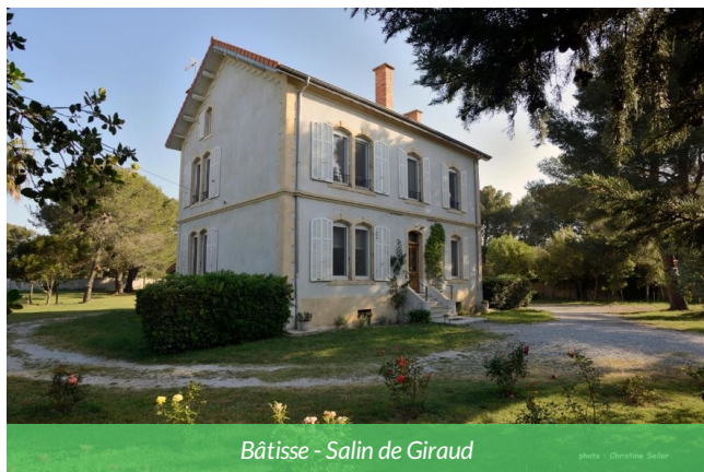
Bâtisse - Salin de Giraud