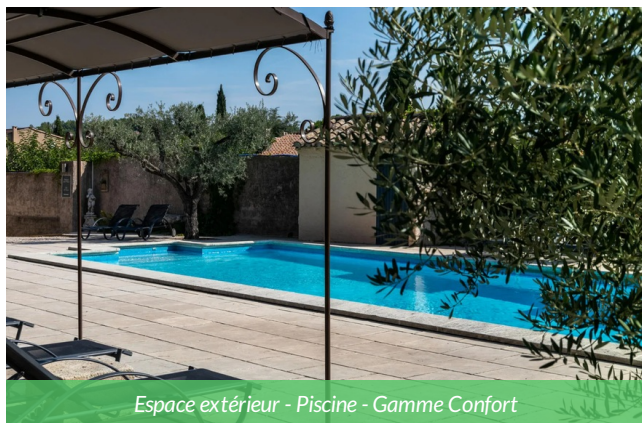
Espace extérieur - Piscine - Gamme Confort

L'établissement se distingue par son jardin de 2 500 m 2 , sa piscine extérieure, sa terrasse ombragée, et un bar convivial. Situé à seulement quelques minutes du centre historique de Saint-Rémy.