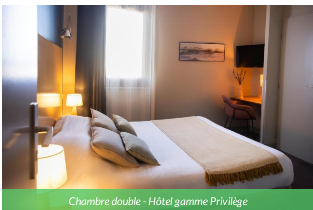
Chambre double - Hôtel gamme Privilège

Idéalement situé sur les berges du canal, cet hôtel offre un cadre exceptionnel. Les chambre, à la décoration contemporaine et raffinée mêlent parfaitement à la fois le bois et la lumière. Un piscine extérieure chauffée est également à disposition.