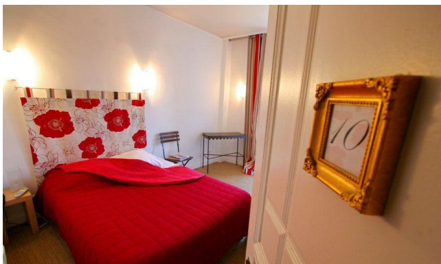
Hôtel à Béziers