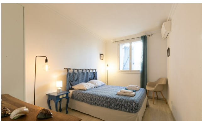
Maison d'hôte à Sète

Pour cette formule, nous vous proposons une sélection de maisons d'hôtes et d'hôtels 2* confortables