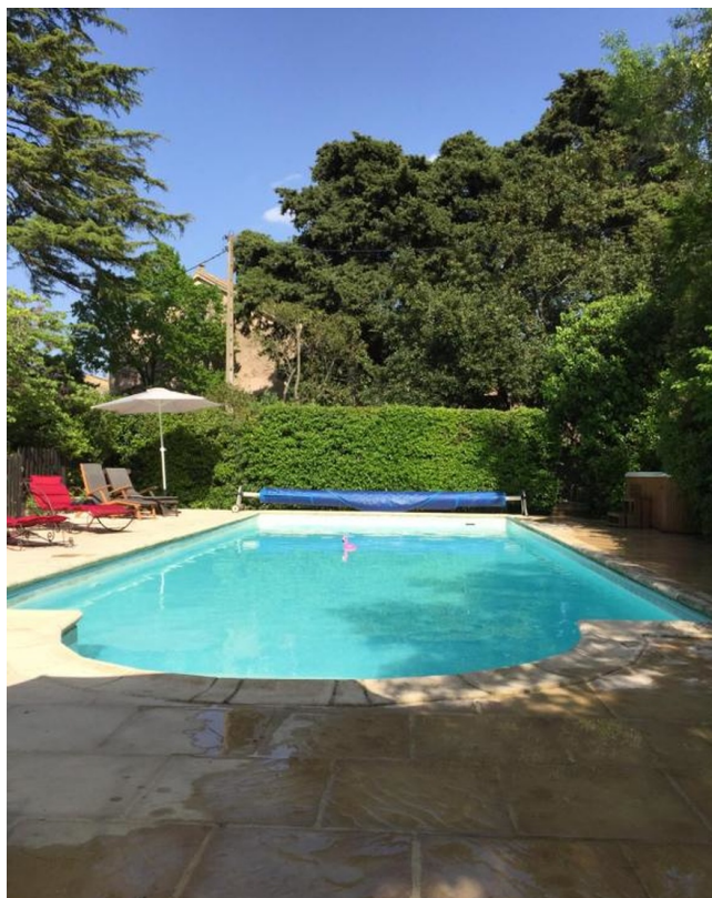
Piscine - Gamme Confort

Situé au cœur d'Olonzac, au centre du Minervois, l'hébergement est une halte idéale sur votre voyage à vélo de Carcassonne à Collioure le long de la Route des Vins. Cette maison de caractère offre un accueil chaleureux et un environnement paisible au milieu des vignobles, parfait pour se ressourcer après une journée entre Canal du Midi, domaines viticoles et paysages du Languedoc. Proche des villages typiques et des caves du Minervois, Éloi Merle est une adresse privilégiée pour les cyclistes en quête de confort et d'authenticité en Occitanie.