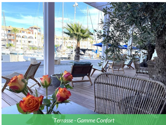
Terrasse - Gamme Confort

L'hôtel à Leucate est une adresse idéale pour une étape en bord de mer lors d'un voyage à vélo de Carcassonne à Collioure sur la route des vins du Roussillon. Situé entre l'étang de Leucate et la Méditerranée, l'hôtel offre un confort moderne et un accès direct aux pistes cyclables du littoral. À proximité, les voyageurs peuvent découvrir les produits locaux : huîtres de Leucate, vins du plateau, fruits de mer, miels du littoral et spécialités catalanes. Une halte parfaite pour savourer le terroir méditerranéen avant de reprendre la route vers les paysages colorés de Collioure.