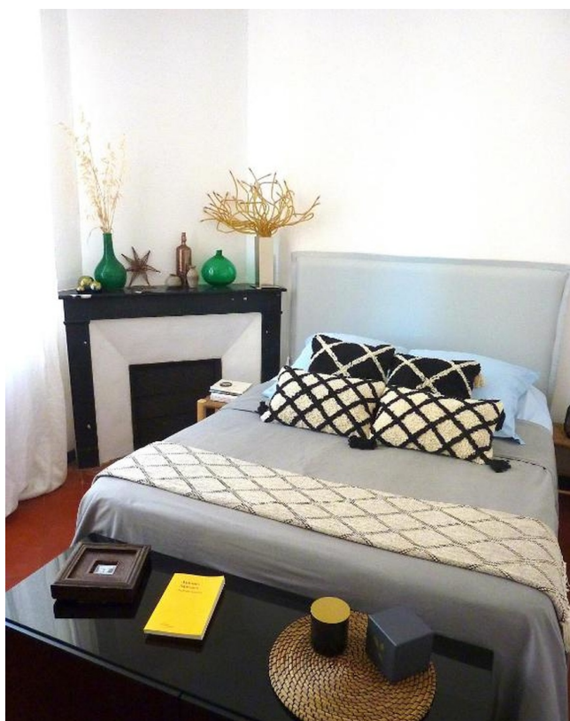
Chambre double - Gamme Confort

Cet hébergement à Narbonne est une halte idéale pour un voyage à vélo de Carcassonne à Collioure sur la route des vins du Languedoc et du Roussillon. Située près du centre historique et des itinéraires cyclables de la Narbonnaise, elle offre un cadre chaleureux pour découvrir les saveurs du terroir. Séjourner à la Maison Narbonnaise, c'est profiter d'un hébergement confortable tout en s'immergeant dans la richesse gastronomique du Sud, avant de poursuivre votre itinéraire à travers les vignobles et vers les couleurs de la méditerranée.