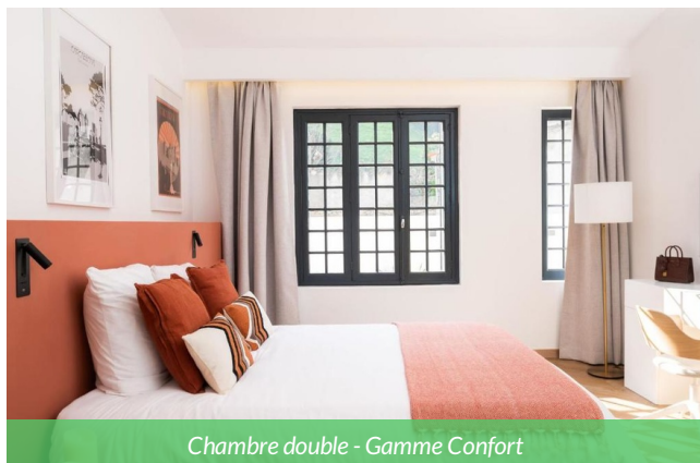
Chambre double - Gamme Confort

Cet hébergement idéalement située au cœur de Carcassonne, constitue une étape parfaite pour débiter votre voyage à vélo sur la Route des Vins jusqu'à Collioure. Cette demeure de charme associe élégance historique et confort moderne, offrant un cadre paisible après une journée passée entre vignobles du Languedoc, Canal du Midi et découvertes œnotouristiques. Ses chambres spacieuses et son accueil chaleureux en font une adresse privilégiée pour les cyclistes souhaitant profiter du patrimoine carcassonnais avant de rejoindre les paysages viticoles de l'Occitanie.