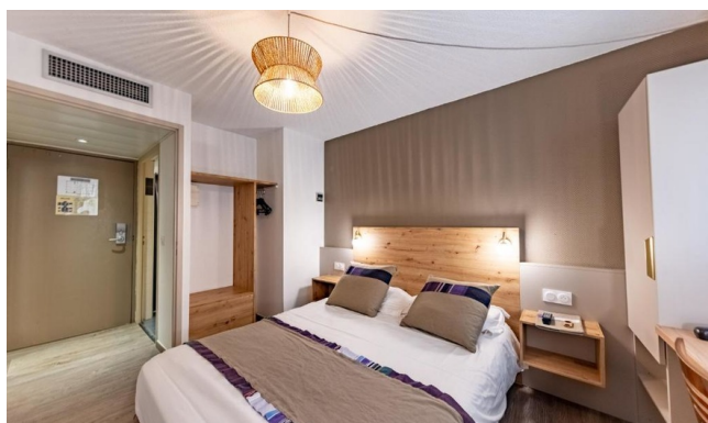
Chambre double - Gamme Confort